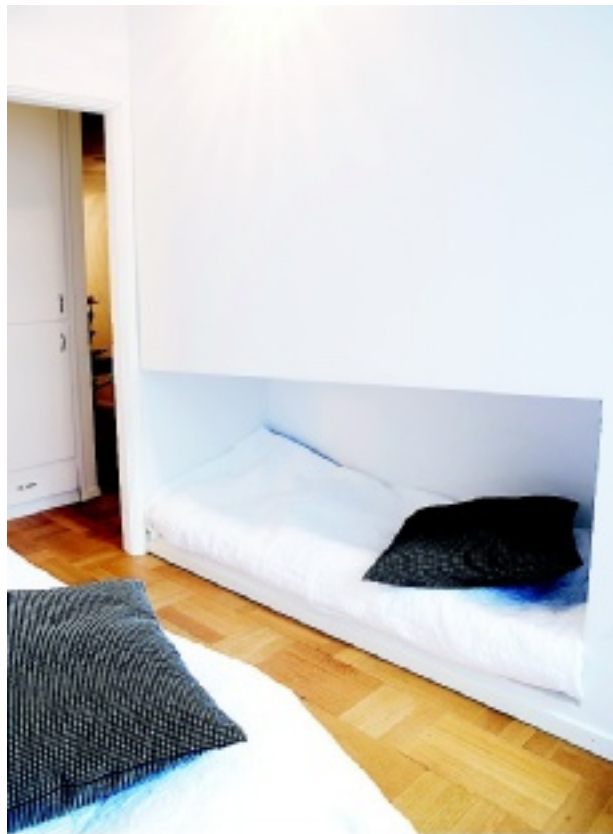
Det är både mysigt och utrymmesbesparande med sängar som är inbyggda i väggen.