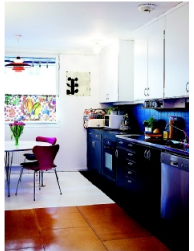
I köket har de ursprungliga luckorna i trä från 1960-talet fått vara kvar men lackerats om.