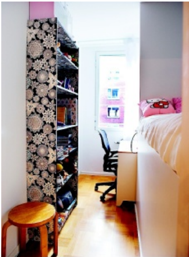
Det gamla vardagsrummet har blivit två sovrum och de två äldsta döttrarna har fått varsitt litet krypin.